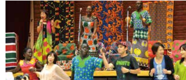
上左 小学校での出前講座 上右 緊急募金の呼びかけ 中 子どもの権利条約を熱心に学ぶ参加者 下段 ケニアのケベラスラムより青年を迎えての国際理解講座