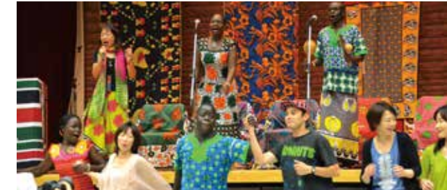
上左 小学校での出前講座 上右 緊急募金の呼びかけ 中 子どもの権利条約を熱心に学ぶ参加者 下段 ケニアのキベラスラムより青年を迎えての国際理解講座